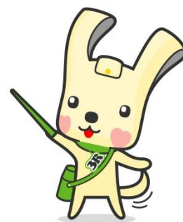
「ヨコハマ3R夢！」 マスコット『イーオ』