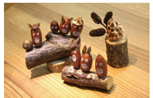
クラフトワークショップ（イメージ）