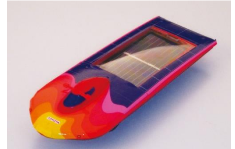
ソーラーカー（イメージ）