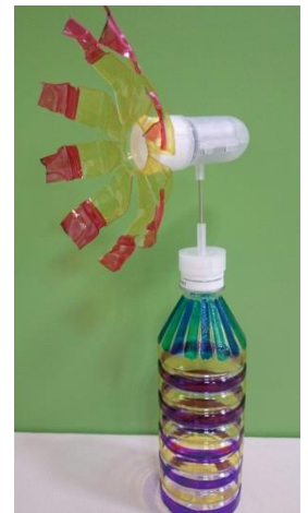
制作するペットボトル（イメージ）