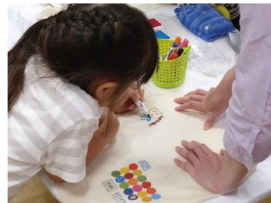
エコバッグ作り（イメージ）